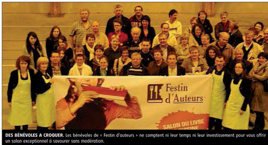
DES BÉNÉVOLES A CROQUER. Les bénévoles de « Festin d'auteurs » ne comptent ni leur temps ni leur investissement pour vous offrir un salon exceptionnel à savourer sans modération.

Lire un livre sans en connaître son auteur n'a que bien peu d'intérêt. Aller à la rencontre de ces femmes et de ces hommes, gourmands, gourmets et généreux est aussi l'occasion de mieux comprendre diverses manières de cuisiner, d'aller à la découverte de goûts nou-