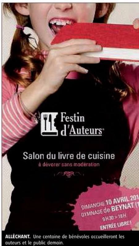
ALLÉCHANT. Une centaine de bénévoles accueilleront les auteurs et le public demain.