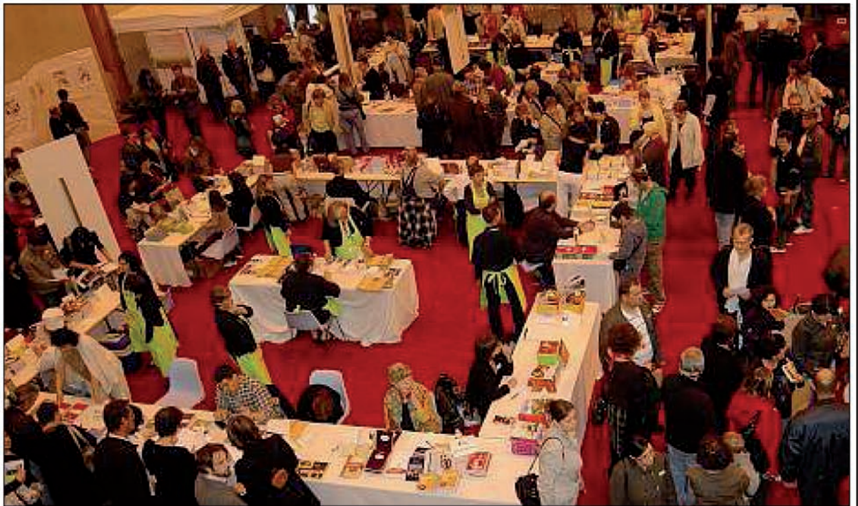
DÉDICACES. Cinquante-sept auteurs étaient à disposition des visiteurs, gourmands de dédicaces et d'échanges.

Festin d'auteurs, le premier salon du livre de cuisine en Limousin, organisé par l'Office de tourisme du Pays d'Aubazine-Beynat, s'est tenu, hier. Près de 2.000 visiteurs sont venus « dévorer sans modération ».